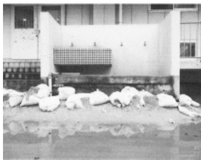
桜が丘小学校体育館西側 外の水道

豪雨で、冠水してしまう道路がたくさんあります(写真右)。下水道組合では「取手市内水実績マップ」を作成しました。このマップは、冠水被害を知り、避難経路を考える上でとても役立ちます。これをもとに、取手市「内水ハザードマップ」を作成し「防災マップ」と一緒に配布すべきと要望しました。 また、子どもたちの登下校の安全確保のためにも、学校の危険マップと防災マップを合わせたものが必要です。