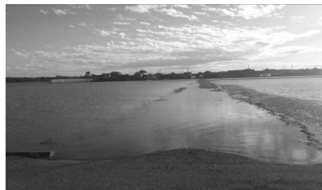
藤代南中学校前田んぼ脇の市道